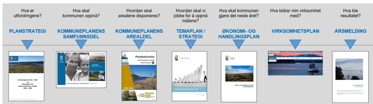
Sammenhengen mellom elementene i plansystemet.

I den årlige økonomi- og handlingsplanprosessen prioriterer kommunestyret hvilke tiltak og satsingsområder som skal gjennomføres i fireårsperioden. En vellykket overgang fra vedtatte planer til økonomi- og handlingsplanen og gjennomføring, avhenger av at kommunen ikke har for mange planer samlet sett og at hver plan ikke er for omfattende. Prioritering av tiltak innenfor kommunens økonomiske rammer skjer i økonomi- og handlingsplanprosessen.